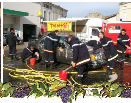
Cocumont Téléthon 2009