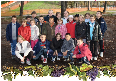
Les élèves au Cross de Gujan