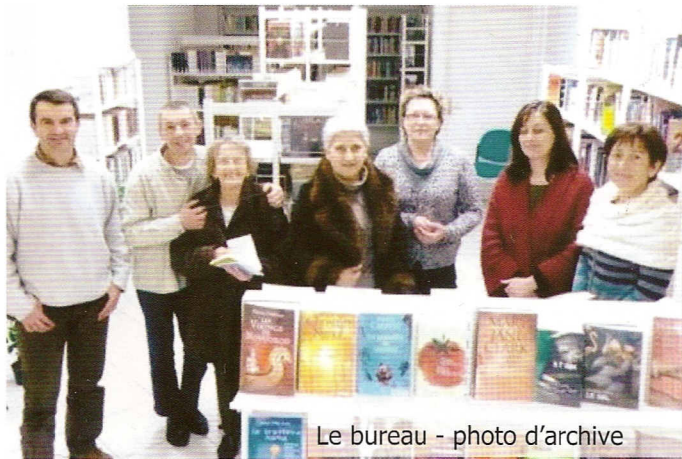
Le bureau - photo d'archive

Le fonctionnement de l'Association repose bien sûr sur le bénévolat, mais il s'appuie sur les subventions de la Commune et du Conseil Général. Il est en outre facilité par la bonne entente de ses membres et la confiance de ses partenaires.